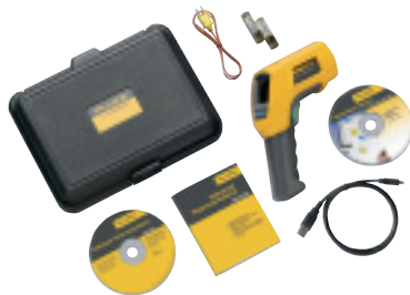
Fluke 568 a standardně dodávané příslušenství