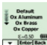
Výběr povrchu měření