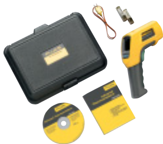
Fluke 566 a standardně dodávané příslušenství