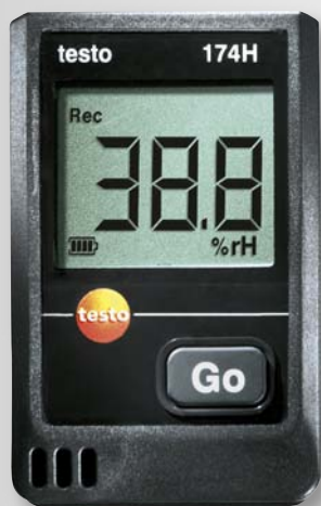
Obrázek: skutečná velikost