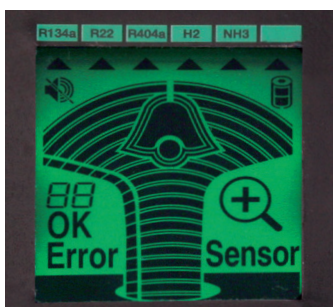
Neustálá kontrola senzoru