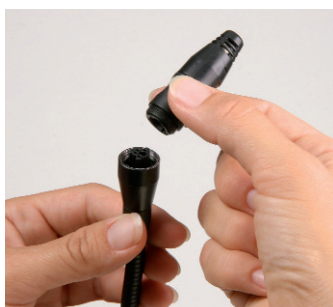
Snadná výměna senzoru uživatelem