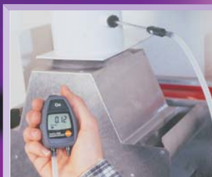
Dva měřicí rozsahy; měření tlaku plynu a kominového tahu