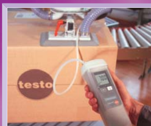
Kontrola na výrobní lince