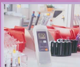
Měřič absolutního tlaku umožňuje měření barometrického tlaku