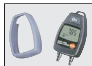
Ochranné pouzdro Softcase