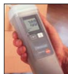
Ochranné pouzdro topsafe (příslušenství)

testo 511 (1000 hPa/mbar) Diferenční tlakoměr vhodný pro údržbu průmyslových výrobních postupů. Obj.č. 0560-5112